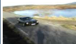
Pontiac Trans Am 1976 Bømlø