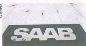
800 ingenjörer finns på Saab.

både fylla fabriken i Trollhättan och bli över beroende på hur skickligt det utvecklas, säger han.